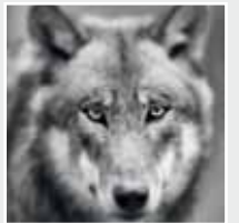
Der Leitwolf. The leader of the pack.